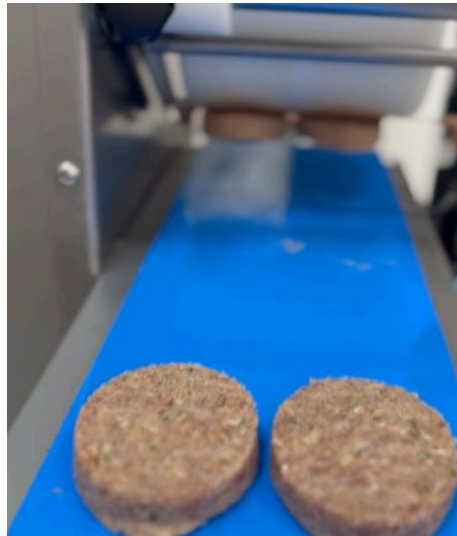
Köfte Form (Şekillendirme) Makinesi

Köftelerinizi istediğiniz gramaj ve şekillerde özenle el değmeden hazırlıyoruz.