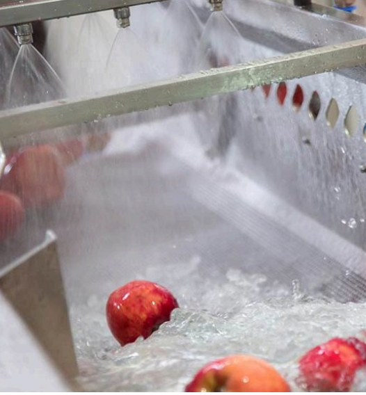
(Sebze - Meyve Yıkama Makinesi)

Tüm sebze ve meyveleri yüksek basınçlı suyun etkisi ile hijyenik bir şekilde yıkayarak sizlere sunuyoruz.